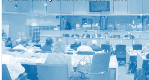
The European Parliament hosted "Parent's responsibility to educate and protect children" session of ENSP meeting: Brussels 9 November 2010

To ward off this eventuality, ENSP has invited Italy to join one of the next activity: the "TobTaxy capacity-building project" organized by the "smokefreepartnership" and financed by the European Union with the aim to spread the correct knowledge on tobacco taxation and its preventive use. We'll talk about it in the next issue, do not miss it! ■